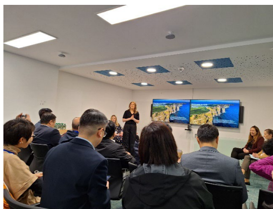
了解教育體制與質素保證

愛爾蘭國會為兩院制，設眾議院及參議院，校長團參訪當天，剛好可以列席及聆聽審議法例，喜獲