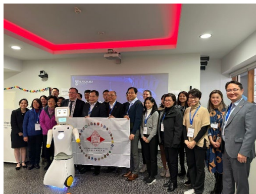
與都柏林聖三一大學接待人員合照