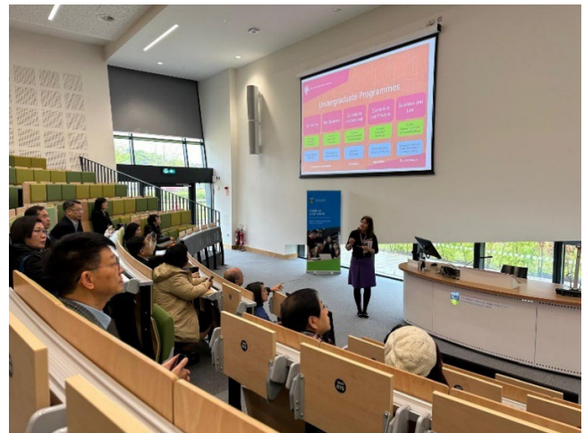
科克大學課程簡介