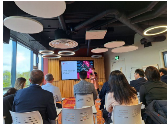
高威大學課程簡介