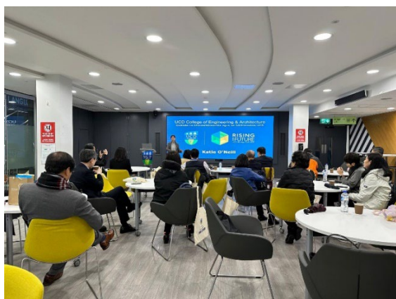
UCD 聖三一大學課程簡介