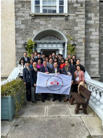
參觀國王醫院學校

愛爾蘭的私立中學如 KHS 與 VS 同樣提供寄宿或住宿安排，初中三年設核心課程，高一為過渡年〔Transition Year〕，課程主要涉及非學術科目、服務學習及生涯規劃等，實為一大特色，其後高二及高三設核心與選修課程，方便學生建立核心科目能力及寬廣的學術基礎，隨後應考全國高考〔Leaving Certificate〕或國際文憑大學預科課程〔International Baccalaureate, IB〕，可按成績、興趣及職志申請入讀愛爾蘭的大學課程，也可透過「非大學聯合招生辦法」〔Non-JUPAS，即非聯招〕申請入讀香港的大學課程，又或申請入讀英國三年制的大學課程，可省下一年的開支！