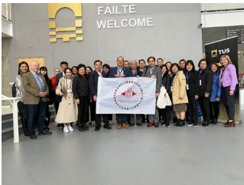
造訪香農理工大學（中部中西部）