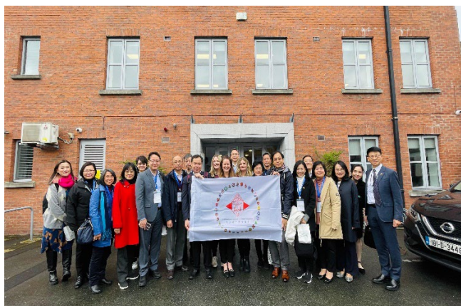
愛爾蘭質量及學術保證機構

官方機構 QQI 制定 10 個級別的国家資歷框架〔National Framework of Qualifications, NFQ〕，對不同教育機構的資歷進行比較，確保這些資歷在愛爾蘭及海外的認受性。愛爾蘭 NFQ 系統與 ENIC-NARIC〔歐洲資訊中心網路/國家學術承認資訊中心〕是相容的，學生在愛爾蘭獲得的學術資歷在其他歐洲國家及美國、加拿大、澳大利亞和紐西蘭皆獲承認。