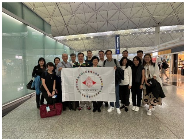
香港國際機場出發合照

聖公會中學校長會致力推動聖公會屬校的專業發展，從而促進學生全人教育，遂於本年接受愛爾蘭商貿部駐港辦公室〔 The Hong Kong Office of Enterprise Ireland 〕的邀請，並獲愛爾蘭駐香港總領事館〔 The Consulate General of Ireland, Hong Kong 〕及愛爾蘭國際教育中心〔 The Irish International Education Centre 〕的協助，於2024年4月26日至5月5日舉行愛爾蘭教育及文化考察團，期望體驗愛爾蘭文化及了解該地的教育體系和學校治理，與當地學校建立友好聯繫，為聖公會學生開拓多一個升學途徑，配合他們未來職志的升學選擇。