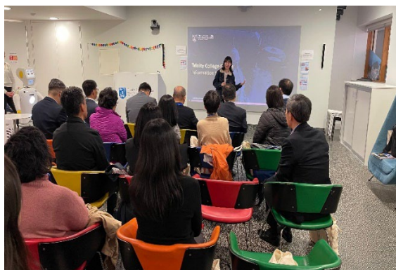
都柏林聖三一大學-香港學生分享留學經驗

愛爾蘭的 TCD、UCD、UG、TUS 及 UCC 五所大學皆是著名大學，具世界排名及提供多元化的學士課程及高級學位課程〔碩士及博士〕，不少學士課程均包含臨時職位〔placement〕或在學實習〔internship〕，讓學生能夠充分理解及熟習職場的工作需要及挑戰，同時懂得應用大學所學，連結學術與實務，畢業後更容易適應職場的要求。